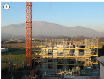
Abitaremeglio in costruzione a Brembate Sopra

Costano un po' di più (dal 10 al 15 %) rispetto alle altre abitazioni offerte dal mercato locale di Brembate Sopra. Ma sono anche le prime costruzioni plurifamiliari in Italia con la certificazione svizzera Minergie: secondo gli esperti il maggiore costo si ammortizza molto rapidamente, grazie al risparmio energetico.