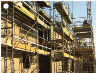
Dettagli della costruzione