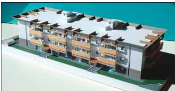
Il plastico dell’edificio Abitare Meglio di Brembate Sopra, realizzato con materiali e tecniche innovative

La Nava G. ha tradotto tutto questo in realtà, tanto da meritare il premio per l’Innovazione tecnologica assegnato nel corso dell’ultima edizione della Fiera edile di Bergamo per gli elementi innovativi introdotti nella costruzione del complesso immobiliare residenziale “Abitare Meglio” (a Brembate Sopra): 1.816 metri quadrati, 22 appartamenti in Classe A+ (come da attestato provvisorio certificazione energetica), un’emissione di CO 2 pari a un